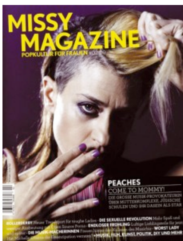
Abb. 2: Missy Magazine , Ausgabe 02/09

„Missy ist ein Magazin für Frauen, die sich für Popkultur, Politik und Style interessieren – für Frauen wie uns halt. Missy verzichtet auf die 10.000. Anleitung zur richtigen Diät, dem richtigen Look oder dem richtigen Leben. Jede Frau hat schließlich ein Gehirn, um selbst zu entscheiden, was sie gut und was sie schlecht findet.“ 17